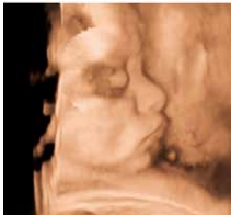
上：陣痛室 下：胎児の 3D 写真