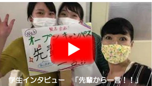
学生インタビュー「先輩から一言!!」

おかげさまで約2カ月間総視聴数4,800回を超えてきました(^^)!! 今年度のWebオープンキャンパスでの動画は最終となります。 今後は学校公式チャンネルにて「戴帽式」の動画等をアップしていきます。