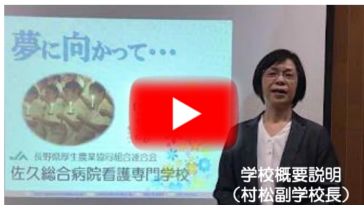
学校概要説明 (村松副学校長)