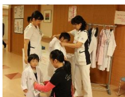
医師・看護師体験コーナー