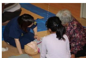
救急隊による初期救急講習会、消防士体験コーナー