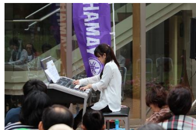
エレクトーン演奏