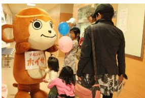
キャラクターによる風船配り