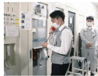
◀消防署へ現場の状況を伝える訓練者

このほか、地震等でエレベーターに人が閉じ込められた際の救出訓練やエアストレッチャーを使った患者さんの搬送、訓練用消火器を使った消火訓練も行いました。