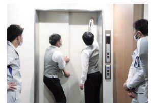
停止したエレベーターを開錠して、安全に救出する手順を学びました▶