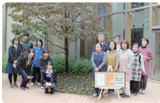
▲参加した皆さんと記念撮影

美しい花壇づくりにいつもご協力いただいているボランティアの皆さん、ありがとうございます。