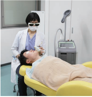
男性のひげ脱毛の様子

治療を希望される部位を事前に剃毛してきていただきます。目を保護するプロテクターをつ