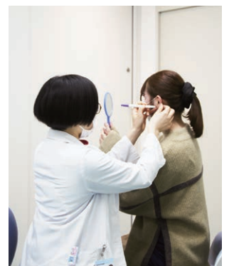
穴あけをする位置を相談して決めます

当院では単回使用のピアッサーを用いて清潔に穴あけを行います、あけた後のアフターケアについても指導しています。万一、化膿してしまったり、ケロイドになってしまった場合でも、医療機関であれば早めに対応することができます。