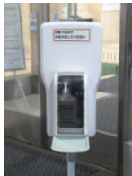
◀正面玄関に設置している手指消毒剤