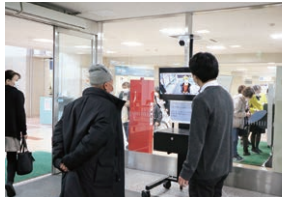
▲正面玄関での検温

また、院内では 不織布マスクの着用 ・ こまめな手洗いと手指消毒 ・ 咳エチケット ・ 他の方との距離を取る などの感染対策にも引き続きご協力をお願いいたします。