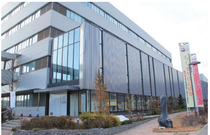
千曲市役所新庁舎