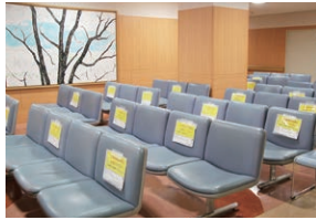
▲外来待合室では間隔をあけてお座りください